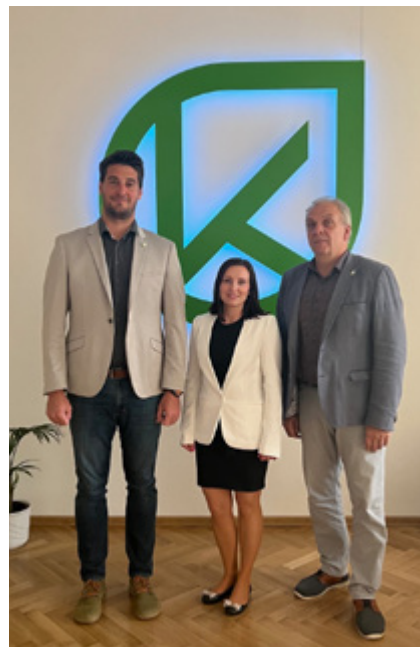
nový/á ředitel/ka s představiteli zřizovatele.

na úspěchy, kterých škola dosahuje a nadále je rozvíjet. Naše škola funguje dobře, edukační proces zajišťuje kolektiv zkušených pedagogů a vychovatelů. Svědčí o tom výsledky z různých vědomostních soutěží, olympiád, sportovních klání. K nejdůležitějším ukazatelům patří vysoká úspěšnost v přijímání žáků posledních ročníků na střední školy. Chci se zaměřit na místa, kde vidím potenciál ke zlepšení. Vše je ale důležité činit s rozvahou a důkladnou přípravou.