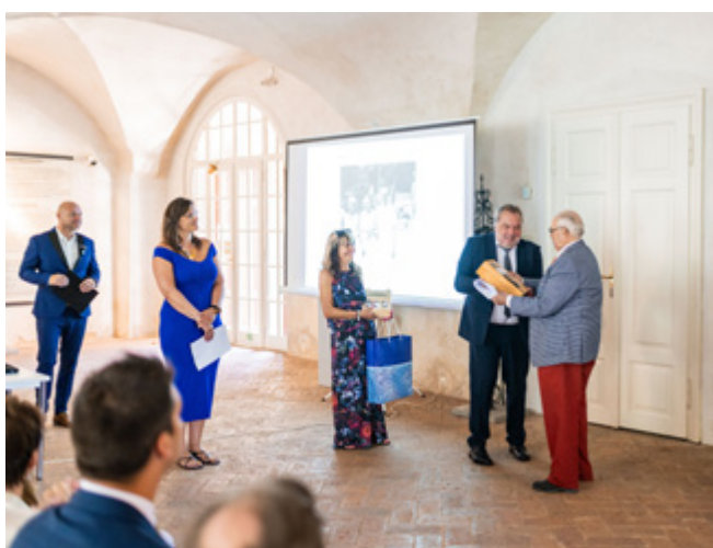
Majitel Pivovaru Kamenice předává baronu Geymüllerovi speciálně pro tuto příležitost uvařené pivo